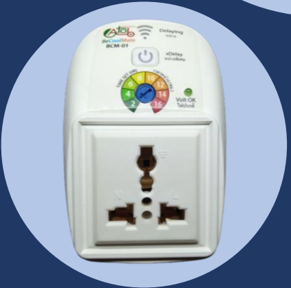
เต้ารับแบบสากล (Universal Socket)