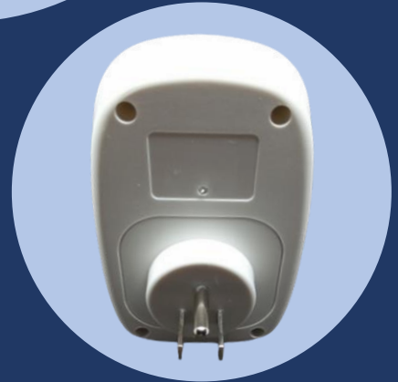
เต้าเสียบแบบสามขา-US (US Plug)